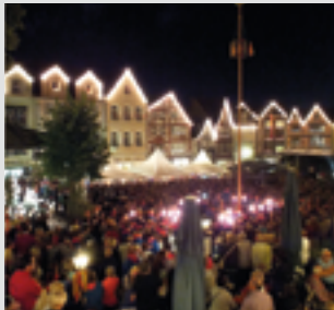
Kirmesstimmung „Alter Markt“.