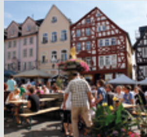
Wein- und Schlemmerfest