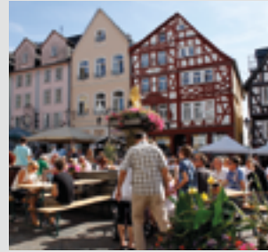
Wein- und Schlemmerfest